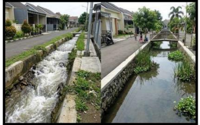
Gambar 1c. Debit Aliran di Selokan