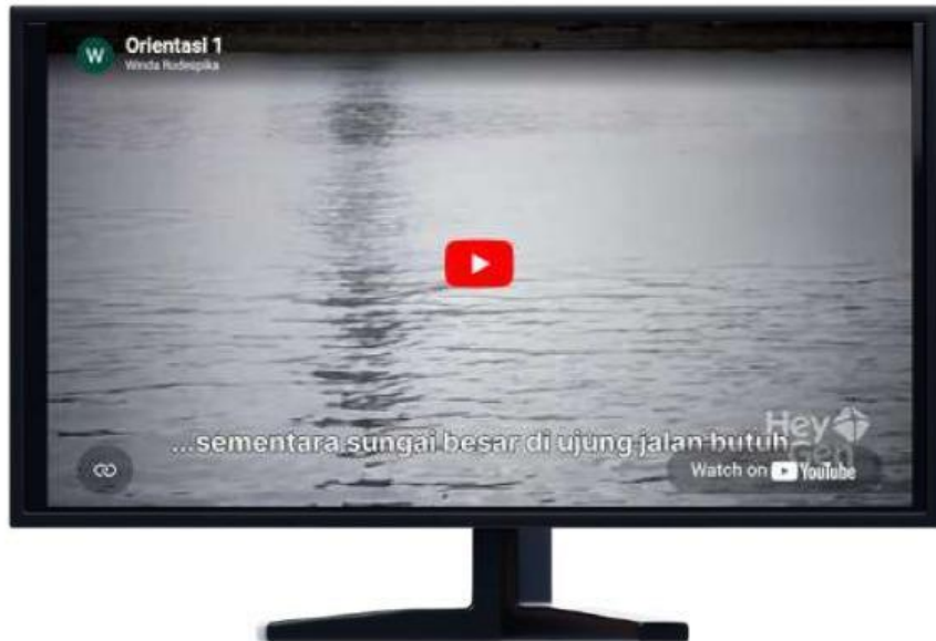
Video 1. Orientasi

Sebelum memulai pembelajaran di kelas, silahkan Ananda amati video fenomena berikut!