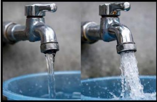
Gambar 1b. Debit Aliran Keran Air

Amati gambar dibawah ini dan bacalah dengan cermat wacana berikut!