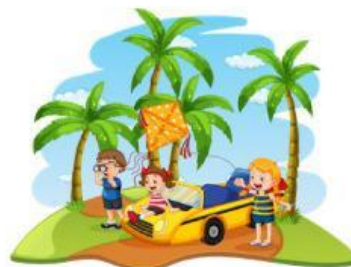
Liburan ke Pantai