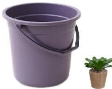
Gambar ember dan tanaman dalam pot

Keesokan harinya, tanaman tersebut akan dipindahkan ke dalam 40 pot berbentuk tabung tanpa tutup dengan jari-jari 5 cm dan tinggi 12 cm. Untuk memperindah tampilan pot-pot tersebut, bagian luar pot akan dicat pada bagian selimutnya saja. ( 1 \text{ cm}^3 = 1 \text{ mL} )