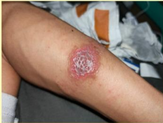
Bakteri penyebab infeksi kulit

Perhatikan gambar berikut dan jawablah pertanyaannya!