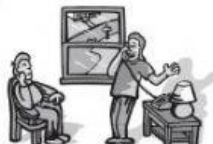
bei einem Freund.