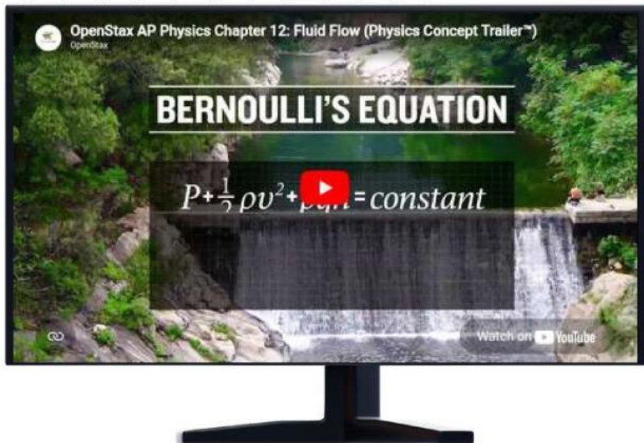
Video 1. Penerapan Prinsip Bernoulli pada Teorema Torricelli

1. Mengamati dengan mengekspresikan maksud atau arti dari informasi.