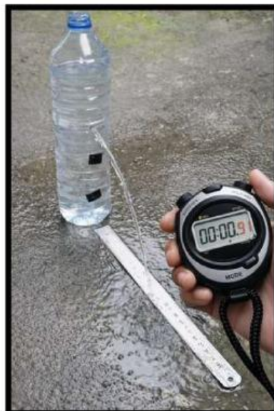
Gambar 2. Percobaan Teorema Torricelli