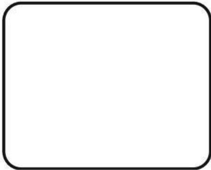
Penyebab Pencemaran Udara

Seretlah gambar-gambar berikut untuk dipasangkan sesuai penyebab dan dampak dari pencemaran lingkungan yang terjadi!