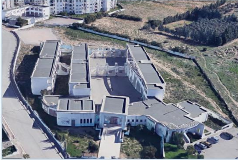
مدرسة عمر المختار بسيدي حسين، تونس