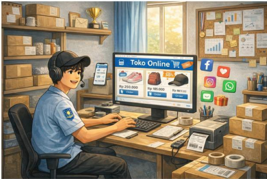
Gambar 2 Ilustrasi siswa mengelola toko online melalui marketplace

Seorang siswa jurusan pemasaran mengelola sebuah toko online yang menjual produk fashion melalui marketplace. Untuk mengevaluasi performa penjualan, ia mencatat jumlah paket yang berhasil dikirim dalam dua periode waktu berbeda.