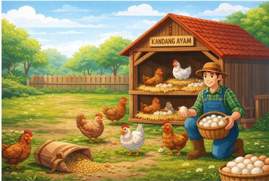
Gambar 1 Ilustrasi kegiatan peternak ayam

Seorang peternak telur ayam mencatat jumlah telur yang berhasil dikumpulkan selama 20 hari dari kandangnya yang dihasilkan oleh puluhan ayam yang dipeliharanya. Telur yang dihasilkan tiap harinya sebagai berikut: