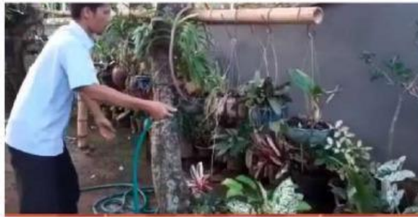
Video 4.1 Asas Kontinuitas pada Fluida Dinamik

Ferdi sedang menyiram tanaman menggunakan selang air di halaman rumahnya. Saat air mengalir, Ferdi mencoba dua cara berbeda, yaitu membiarkan ujung selang terbuka dan menutup sebagian ujung selang dengan tangannya.