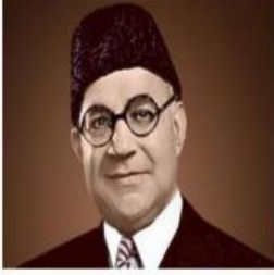
قائد اعظم احمد علی جناح