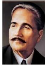
لیاقت علی خان