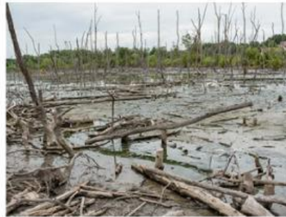
Gambar 1: pohon mati

Pada banyak kota industri, polusi udara dari kendaraan bermotor, pabrik, dan pembangkit listrik menghasilkan gas sulfur dioksida ( \text{SO}_2 ) dan nitrogen oksida ( \text{NO}_x ). Gas-gas ini bereaksi dengan uap air di atmosfer dan membentuk larutan asam seperti \text{H}_2\text{SO}_4 dan \text{HNO}_3 . Ketika hujan turun, air hujan membawa asam-asam tersebut ke permukaan bumi sehingga disebut hujan asam.