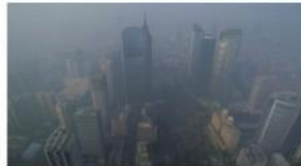
Gambar 2. Polusi Udara

Jakarta - Potensi hujan asam di Indonesia sangat mungkin terjadi di wilayah urban dan industri yang berpolusi tinggi. Hanya saja, hujan tersebut diperkirakan terjadi di awal musim hujan, karena partikel atau polutan yang melayang di udara turun bersama hujan. Kota Jakarta dan Bandung berpotensi mengalami hujan asam.