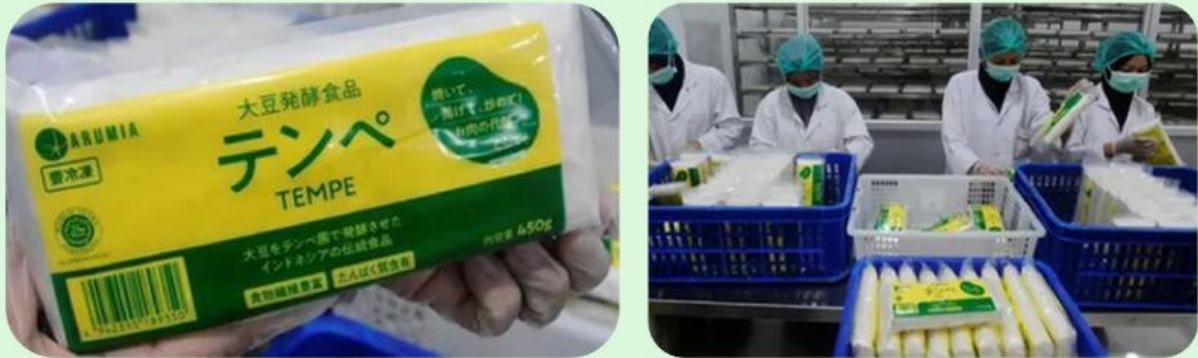
Gambar 1. Pabrik Tempe Azaki Food

Pabrik Tempe Terbesar Dunia di Bogor, Bersih dan Berstandar Tinggi