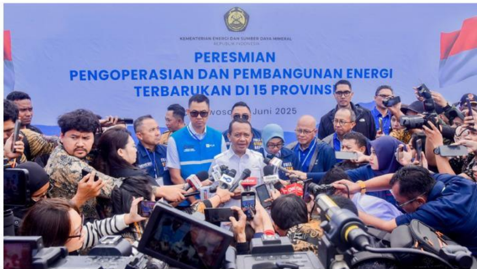
Gambar 2.1: Pemerintah Targetkan 5600 Desa Teraliri Listrik Dalam 5 Tahun