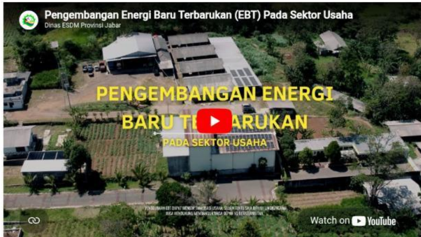
Video 3.1 :Pengembangan Energi Baru Terbarukan (EBT) Pada Sektor Usaha Sumber : https://www.youtube.com/watch?v=-HJSRPLIsCw

keterbatasan listrik di daerah pedesaan dapat diatasi dengan memanfaatkan energi terbarukan yang tersedia di lingkungan sekitar, khususnya aliran sungai melalui Pembangkit Listrik Tenaga Mikrohidro (PLTMH). Energi air dimanfaatkan dengan mengubah energi gerak aliran sungai menjadi energi listrik menggunakan turbin dan generator. Teknologi mikrohidro sangat sesuai diterapkan di desa karena tidak membutuhkan bahan bakar minyak, biaya operasionalnya rendah, serta ramah lingkungan. Pemanfaatan energi lokal ini mampu mengurangi ketergantungan masyarakat terhadap BBM yang mahal sekaligus meningkatkan kemandirian energi desa. Keberhasilan penerapannya juga bergantung pada keterlibatan masyarakat dalam pengelolaan dan pemeliharaan pembangkit listrik tersebut sehingga kebutuhan listrik dapat terpenuhi secara berkelanjutan.