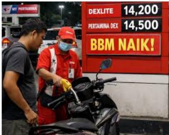
Gambar 3.2 Ramadan, Ekonomi Sulit, BBM Naik

Desa Sumber Jaya selama ini menggunakan genset berbahan bakar minyak (BBM) untuk memenuhi kebutuhan listrik masyarakat. Namun dalam beberapa bulan terakhir, pasokan BBM sering habis karena distribusi yang sulit dan harga yang semakin mahal.