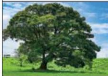
Tallo largo (árboles)