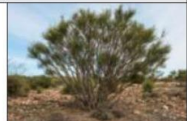
Tallo corto (arbustos)

Los tallos ..... son finos, flexibles y, normalmente, verdes.