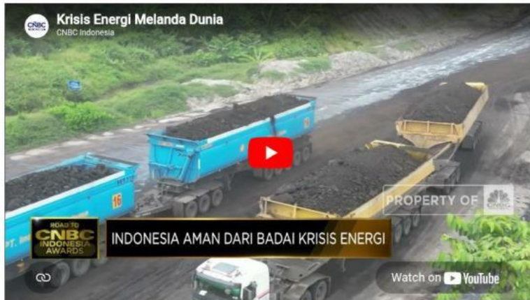
Video 1.1 Krisis energi melanda dunia

Dewasa ini, masih diandalkan dalam pemenuhan kebutuhan energi. Minyak bumi digunakan sebagai pemasok utama kebutuhan energi. Di sisi lain, sumber energi semakin langka dan mahal harganya. Permasalahan energi di Indonesia menjadi sangat penting dan membutuhkan penanganan khusus. Ini dikarenakan oleh hal-hal berikut.