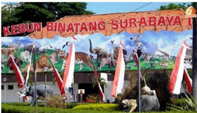
Gambar 6. Kebun Binatang Surabaya (Fadhila, 2020)

Lalu apa perbedaan dari suaka margasatwa dan kebun binatang?