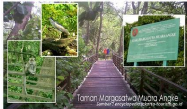
Gambar 7. Taman suaka margasatwa angke (Eva, 2022)