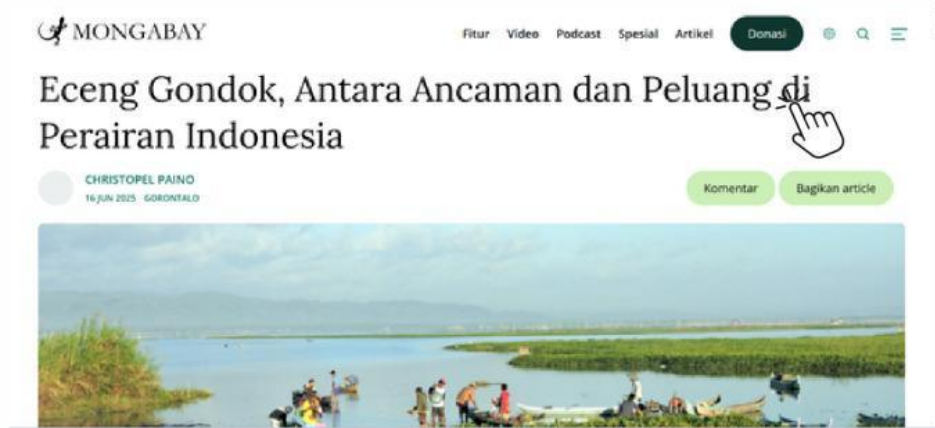
Gambar 6. Kondisi perairan eceng gondok di Indonesia (Paino, 2025)

Di setiap sudut perairan tawar Indonesia, mulai dari danau-danau hingga aliran sungai yang tenang, sering kita jumpai hamparan hijau mengapung yang begitu mendominasi: eceng gondok. Tanaman dengan nama ilmiah Pontederia crassipes ini, dengan bunganya yang anggun, sekilas tampak tak berbahaya. Namun di balik keindahannya, eceng gondok ternyata mengancam ekosistem perairan di Indonesia.