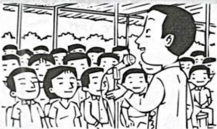
秦明专心地聆听演讲