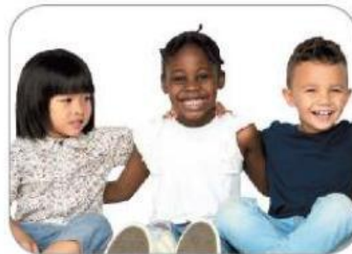
사람마다 피부색이 다르다.