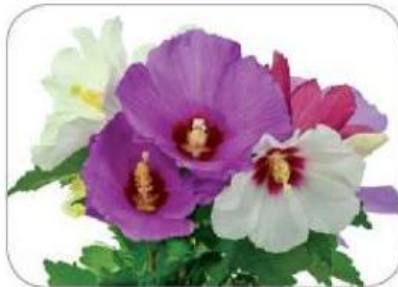
무궁화마다 꽃 색깔이 조금씩 다르다.