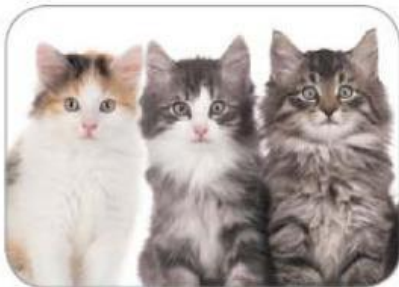
고양이의 털색과 무늬가 다르다.