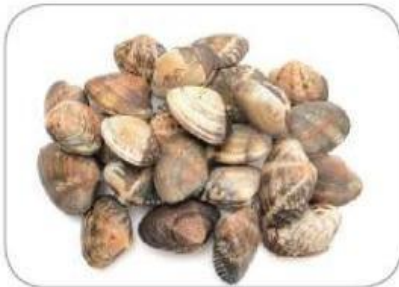
바지락 껍데기의 무늬와 색깔이 조금씩 다르다.