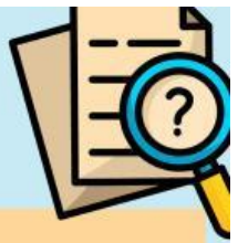
Tabel pengumpulan informasi