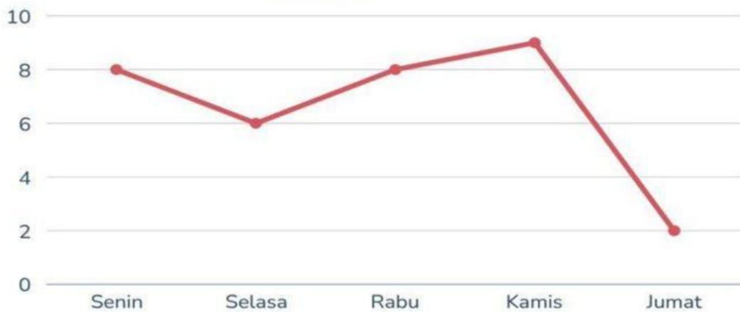
Data Setoran Hafalan Siswa SMPN 7 Bukittinggi di Bulan Ramadhan