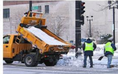
Gambar 2. Penambahan garam pada salju