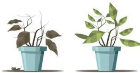
Gambar 3. Tanaman layu menjadi segar kembali

Dari ketiga contoh di atas ada beberapa persamaan: