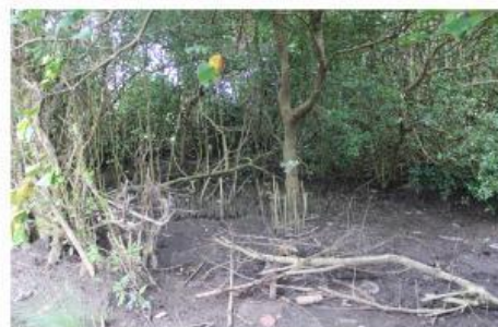
Gambar Abrasi Mangrove Baros