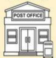
La oficina de correos