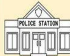
La estación de policía