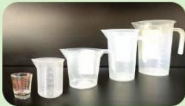
ถ้วยตวงของเหลวขนาด 20 100 250 500 และ 1,000 มิลลิลิตร