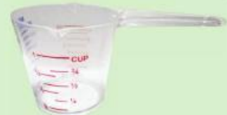
ถ้วยตวงของเหลว ขนาด 1 ถ้วยตวง