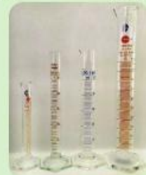
กระบอกตวงขนาด 100 250 500 และ 1,000 มิลลิลิตร