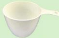
ถ้วยตวงของแห้ง ขนาด 1 ถ้วยตวง