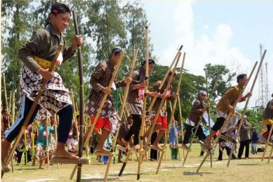
Gambar 1. Permainan Tradisional Egrang

Egrang merupakan permainan tradisional yang telah lama dikenal di berbagai daerah di Indonesia, seperti di Jawa, Sumatra, dan Kalimantan. Permainan ini biasanya dibuat dari bambu yang mudah ditemukan di lingkungan sekitar, sehingga mencerminkan kearifan lokal masyarakat dalam memanfaatkan sumber daya alam. Egrang tidak hanya dimainkan sebagai hiburan, tetapi juga sering ditampilkan dalam kegiatan budaya, seperti perayaan hari kemerdekaan atau festival desa.