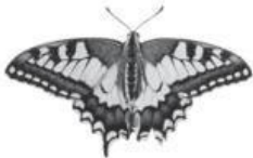
1 a beautiful butterfly

2 Uzupełnij przymiotniki pod zdjęciami zwierząt.