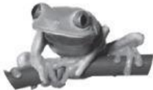
4 an i _____ frog