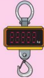
เครื่องชั่งแบบแขวน