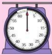
เครื่องชั่งสปริง พิกัด 60 กิโลกรัม