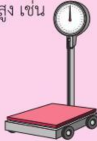
เครื่องชั่งสปริง พิกัด 300 กิโลกรัม