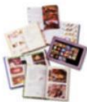
..... de campo