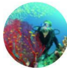
Equipo de b.....