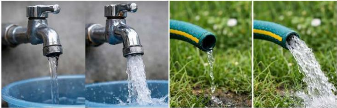
Gambar 2. Debit Aliran

1. Mengamati dengan mengekspresikan maksud atau arti dari informasi.