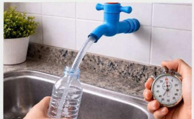
Gambar 1b. Percobaan 2