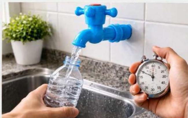
Gambar 1a. Percobaan 1