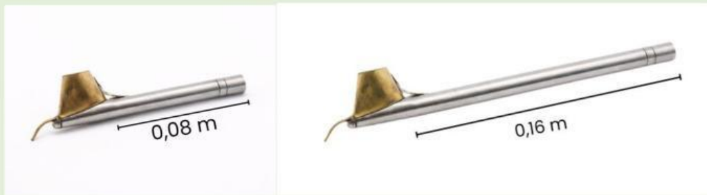
Gambar 3. Canting dengan Gagang Besi Sepanjang 8 cm (kiri) dan Canting dengan Gagang Besi Sepanjang 16 cm (kanan)

Pak Rahmat masih belum merasa puas dengan percobaan sebelumnya dan melakukan percobaan kedua dengan menambah panjang dari gagang besi canting (dihitung dari wadah lilin panas hingga ujung gagang canting) tersebut menjadi dua kali dari semula, yang awalnya 8 cm menjadi 16 cm (perhatikan Gambar 2), selang beberapa menit ia kembali menjatuhkan canting tersebut karena terlalu panas.