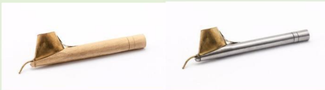
Gambar 2. Canting dengan Gagang Kayu (kiri) dan Canting dengan Bahan Besi (kanan)