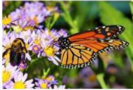
Bunga dan Kupu-kupu