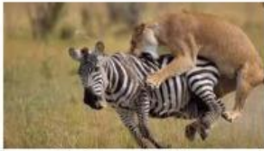
Harimau dan Zebra

Amati setiap gambar di bawah ini, kemudian cocokkan dengan keterangan jenis – jenis pola interaksi di sampingnya.