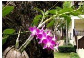
Tumbuhan Anggrek dan Pohon yang ditumpanginya