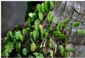
Benalu dan Pohon Mangga