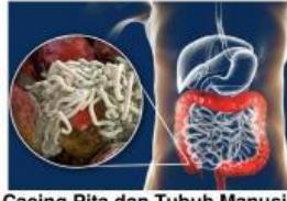
Cacing Pita dan Tubuh Manusia