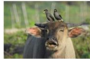
Kerbau dan Burung Jalak