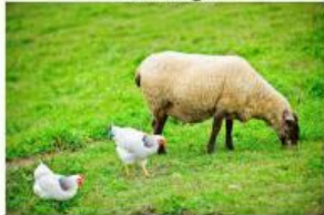
Ayam dan Domba