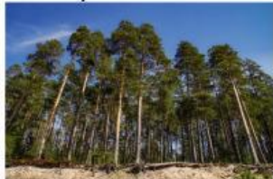
Pohon Pinus dan lingkungannya