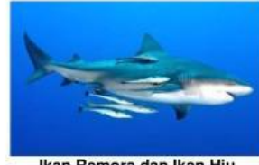
Ikan Remora dan Ikan Hiu