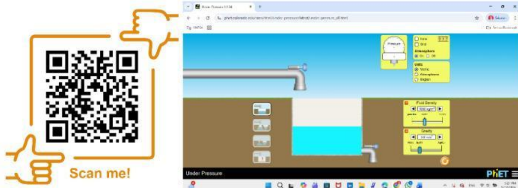
Gambar 2. QR Code PhEt Simulation dan Tampilan Screenshot dari Bagian Awal Virtual Laboratory