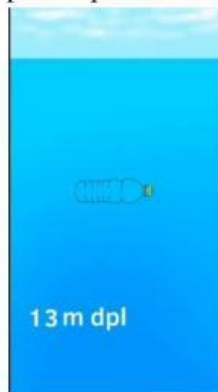
Gambar 1. Ilustrasi Tekanan Hidrostatik

Perhatikan cuplikan video yang ditampilkan pada media pembelajaran berikut!