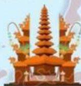
Rumah Gapura Candi Bentar