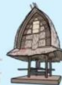
Rumah Adat Bale