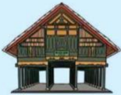
Rumah Krong Bade