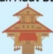
Rumah Adat Buton