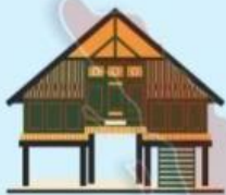
Rumah Bubungan Lima