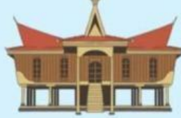
Rumah Selaso Jatuh Kembar