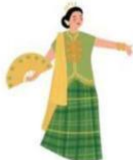
Tari Bamba Manurung