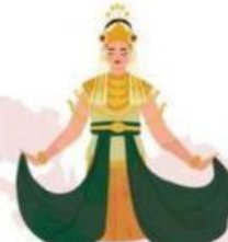
Tari Baksa Kembang