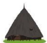
Rumah Mbaru Niang