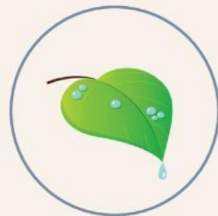
Embun di pagi hari