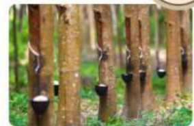
Gambar 3.1 Kebun karet sebagai Sumber Mata Pencarian Masyarakat di Sekitar Candi Bumiayu PALI

Di sekitar Candi Bumiayu Pali, Sumatera Selatan didominasi oleh pertanian kebun karet dan kelapa sawit yang menjadi sumber pendapatan utama masyarakat. Wisata budaya juga berkembang, dengan candi ini menarik pengunjung lokal dan mancanegara, menciptakan lapangan kerja di bidang pariwisata seperti pemandu wisata dan penjualan suvenir. Namun, tantangan seperti infrastruktur terbatas dan ketergantungan pada musim panen masih menghambat pertumbuhan. Kearifan lokal candi, seperti motif relief, dapat dikembangkan menjadi produk kerajinan tangan untuk meningkatkan nilai ekonomi, misalnya melalui UMKM yang memproduksi patung atau kain bermotif candi.