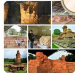
Gambar 4.1 Dokumentasi Kondisi dan Aktivitas di Kawasan Candi Bumiayu PALI sebagai Sumber Inspirasi Pembelajaran

Candi Bumiayu Pali bukan sekadar reruntuhan masa lalu, melainkan sumber inspirasi untuk masa depan daerah. Dengan melestarikan warisan budaya ini, masyarakat dapat membangun identitas yang kuat, meningkatkan pendidikan generasi muda, dan mendorong ekonomi melalui wisata berkelanjutan. Misalnya, motif relief candi dapat diintegrasikan ke dalam seni modern atau pendidikan sekolah, membuat daerah ini 'luar biasa' sebagai pusat budaya dan inovasi. Tantangan seperti degradasi situs dapat diatasi melalui kampanye pelestarian bersama.