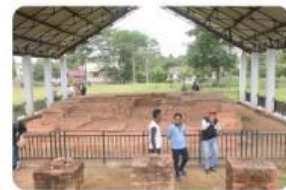
Gambar 4.2 Inspirasi Pemanfaatan Candi Bumiayu PALI sebagai Sarana Edukasi dan Wisata Budaya

"Melalui kearifan lokal seperti Candi Bumiayu Pali, daerah dapat menjadi contoh harmoni antara budaya dan ekonomi. Generasi muda bisa belajar dari sejarah ini untuk menciptakan inovasi, seperti aplikasi wisata digital atau produk kreatif berbasis budaya." (Sumber: Adaptasi dari artikel edukasi tentang pelestarian budaya Indonesia).