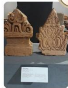
Gambar 2.1 Relief dan arca peninggalan Candi Bumiayu Pali

Candi Bumiayu Pali adalah kompleks candi Hindu-Buddha yang terletak di Desa Bumiayu, Kecamatan Pali, Kabupaten Wonogiri, Jawa Tengah. Dibangun sekitar abad ke-9 Masehi, candi ini memiliki struktur utama berupa stupa dan relief dinding yang menggambarkan kisah epik Ramayana dan Mahabharata. Relief ini menunjukkan kearifan lokal dalam seni pahat dan cerita rakyat Jawa, yang mengintegrasikan nilai-nilai spiritual Hindu-Buddha dengan budaya lokal. Candi ini ditemukan pada tahun 1990-an dan menjadi saksi peradaban kuno di daerah tersebut. Saat ini, candi ini dilestarikan sebagai warisan budaya untuk pendidikan dan wisata.