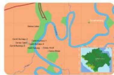
Gambar 2.2 Peta lokasi Candi Bumiayu Pali di Kabupaten PALI, Sumatera Selatan

Menurut arkeolog, Candi Bumiayu Pali mencerminkan sinkretisme budaya antara Hindu dan Buddha, dengan arsitektur yang mirip candi-candi di Jawa Tengah seperti Borobudur. Ini menunjukkan bagaimana masyarakat kuno menghargai seni dan sejarah sebagai bagian dari identitas daerah.