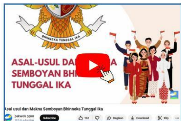
Gambar 1. Video Perwujudan Gotong Royong dalam Ekonomi Pancasila

Untuk mengetahui pemahaman Anda terkait materi itu, buatlah sebuah peta pikiran ( mind map ) sederhana di kertas yang disediakan oleh guru