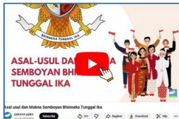
Gambar 1. Video Asal-Usul dan Makna Semboyan Bhinneka Tunggal Ika

Dari aktivitas tersebut, jawablah pertanyaan berikut dengan kalimat sendiri: