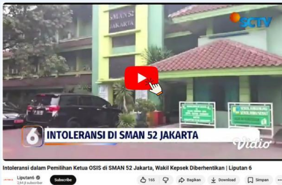
Gambar 2. Video Kasus Intoleransi

Di sebuah SMA negeri, terjadi perselisihan dalam proses pemilihan ketua OSIS. Sejumlah siswa menolak kandidat tertentu karena menganggap latar belakang agama/komunitasnya berbeda dari mayoritas. Perbedaan tersebut memunculkan aksi penolakan dan perdebatan di lingkungan sekolah. Situasi menjadi perhatian publik hingga dinas pendidikan turun langsung ke sekolah. Akibat situasi ini, salah satu wakil kepala sekolah diberhentikan sementara dari jabatannya. Simak video berikut