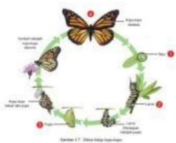
Siklus Hidup Makhluk Hidup

Makhluk hidup adalah semua yang dapat tumbuh, bernapas, berkembang biak, dan mati. Setiap makhluk hidup mengalami siklus hidup, yaitu tahapan pertumbuhan dari awal hingga akhir kehidupannya.