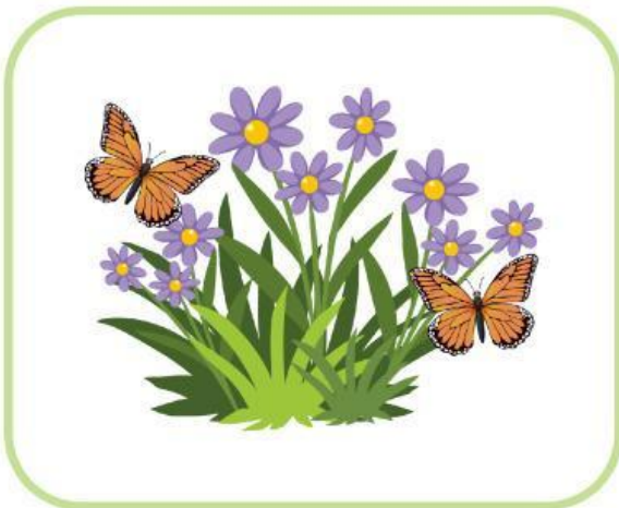
Kupu-kupu dengan bunga

Lihatlah gambar di bawah ini, amati dan cocokkan dengan simbiosis yang tepat pada pilihan di bagian kanan.