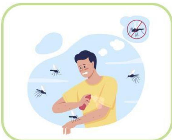
Nyamuk dengan manusia