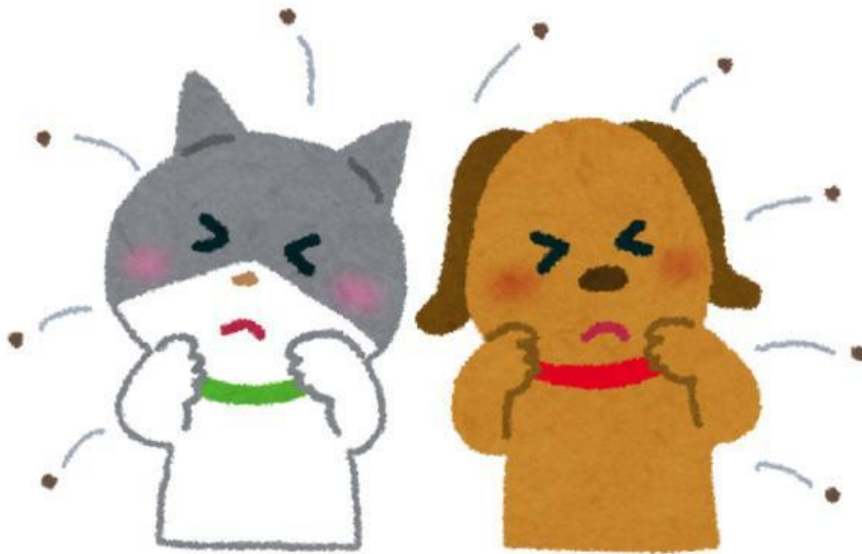
Kutu pada Binatang Berbulu

Lihatlah gambar di bawah ini, amati kemudian buatlah cerita atau paragraf tentang gambar tersebut terkait dengan materi simbiosis.