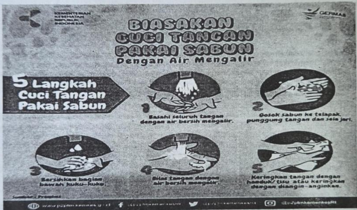
Gambar 2.1 Prosedur Mencuci Tangan yang Benar

Informasi apa yang bisa kalian dapat dari contoh prosedur sederhana pada infografis di atas?