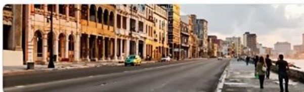
El Malecón, La Habana, Cuba

2 Acentuación y el plural Convierte en plural estas palabras agudas.