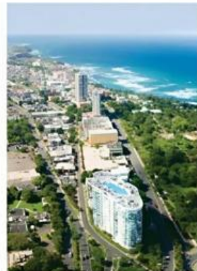
Vista aérea de San Juan, Puerto Rico