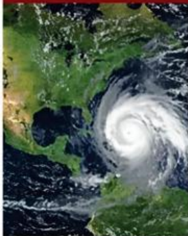
La temporada de huracanes en el Atlántico comienza en el verano.