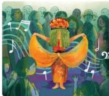
Gambar 1. Contoh Gerakan Tari Seblang

Desa pertama adalah Desa Olehsari di Banyuwangi, Jawa Timur, yang terkenal dengan tari seblang. Tarian yang dilakukan setiap tahun ini diyakini untuk menghindarkan desa dari bahaya. Penarinya biasanya wanita dewasa yang wajahnya ditutupi daun kelapa. Penari memperagakan kegiatan membajak sawah sambil menggendong boneka mengikuti irama musik.