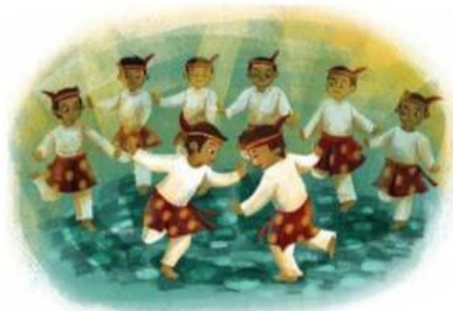
Gambar 5. Contoh Gerakan Tari Seudati

Desa terakhir adalah Desa Gigieng di Aceh dengan tari seudati. Fungsi tarian ini bukan hanya sebagai pertunjukan hiburan untuk rakyat, melainkan juga sebagai sarana dakwah untuk mengembangkan ajaran agama Islam. Tari seudati dibawa oleh delapan pemuda. Gerakan yang dibawa menggambarkan seorang syekh bersama para pembantunya.