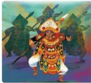
Gambar 2. Contoh Gerakan Tari Dadap

Desa kedua adalah Desa Cempaga di Bali dengan tari baris. Tari ini dibawakan oleh laki-laki dewasa. Gerakannya menirukan pemuda gagah berani yang menerjang medan perang. Tari baris dibedakan menjadi dua berdasarkan jumlah penarinya. Tarian yang dibawakan seorang penari disebut tari jojor, sementara tarian yang dilakukan berkelompok disebut tari dadap.