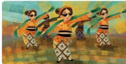
Gambar 4. Contoh Gerakan Tari Umbul

Desa keempat adalah Desa Situraja di Jawa Barat yang terkenal dengan tari umbul. Para penarinya adalah perempuan berkebaya, berselendang, dan memakai kacamata hitam. Gerakannya gemulai, menggoyangkan badan, dan sedikit menirukan gerakan pencak silat. Tari ini mengandung pesan bahwa perempuan juga bisa menjaga diri dengan ilmu bela diri.