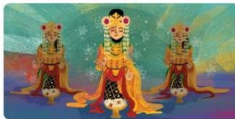
Gambar 3. Contoh Gerakan Tari Baksa Kembang

Selanjutnya adalah Desa Barikin di Kalimantan Selatan dengan tari baksa kembang. Tarian ini dibawakan oleh penari perempuan yang jumlahnya ganjil, misalnya satu, tiga, atau lima penari. Gerakannya meliuk-liuk menggambarkan seorang putri yang sedang bermain di taman bunga. Tari baksa kembang sering dipentaskan di acara-acara besar.