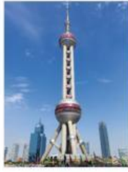
东方明珠塔 Dōngfāng Míngzhū Tǎ