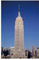
帝国大厦 Dìguó Dàshù