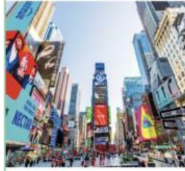
时代广场 Shídài Guǎngchǎng