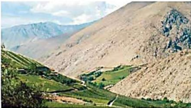
↑ Paisaje del Valle del Elqui, La Serena.