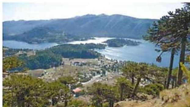
↑ Paisaje de la laguna y poblado de Icalma, Lonquimay.