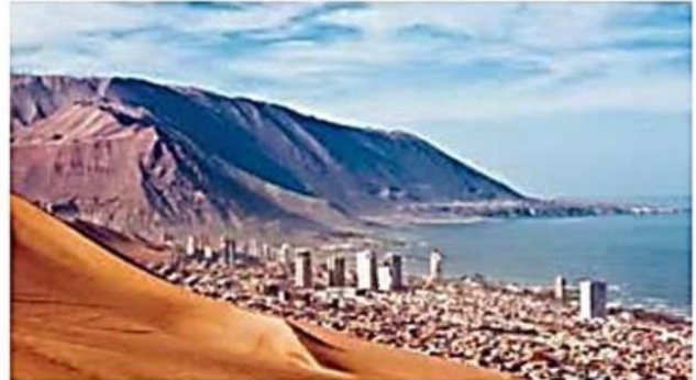
↑ Paisaje de la ciudad de Iquique.