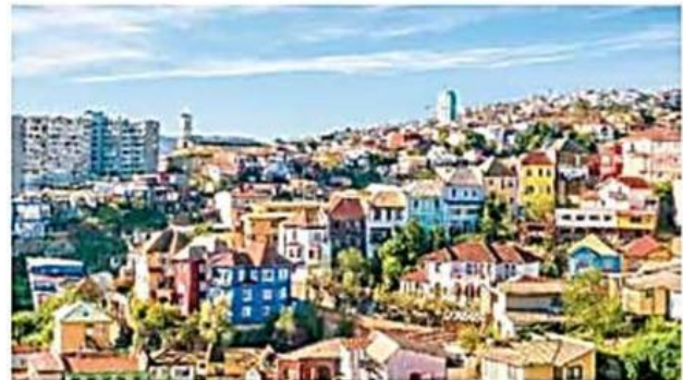
↑ Paisaje de la ciudad de Valparaíso.