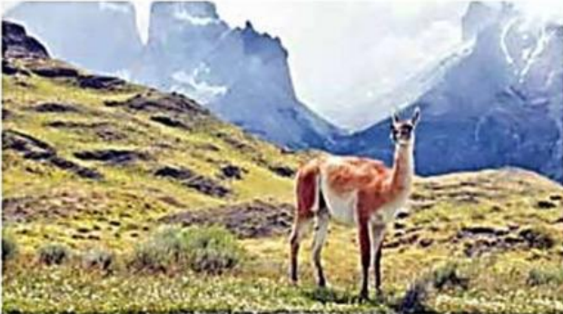
↑ Paisaje del Parque Nacional Torres del Paine.

a. Indica a qué zona natural corresponde cada paisaje.