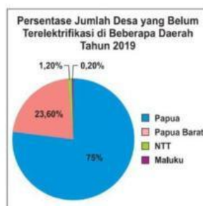
Persentase jumlah desa yang belum terelektifikasi di Indonesia tahun 2019