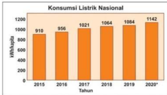
Diagram konsumsi energi listrik Indonesia tahun 2015 sampai 2019, dan target konsumsi energi listrik tahun 2020