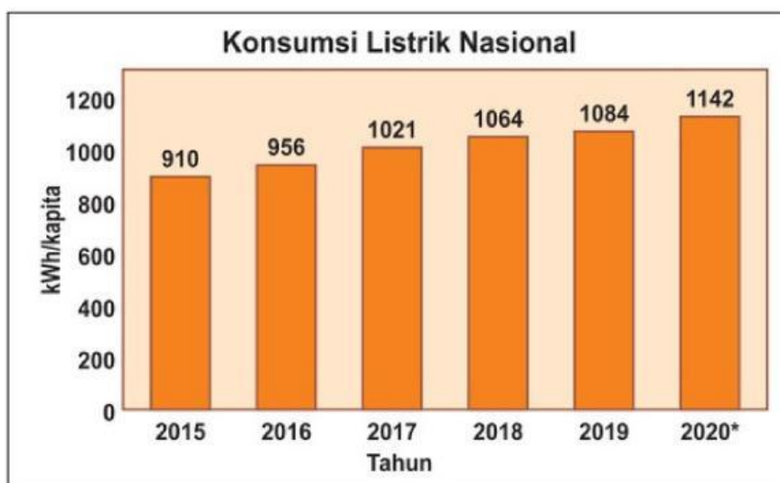
Diagram konsumsi energi listrik Indonesia tahun 2015 sampai 2019, dan target konsumsi energi listrik tahun 2020

Pada era teknologi industri dan digital ini, energi telah menjadi kebutuhan dasar untuk kelangsungan hidup manusia. Hal tersebut terjadi karena manusia sudah memiliki ketergantungan terhadap teknologi yang mempermudah pekerjaannya, sehingga kebutuhan energi ini sangat penting untuk dipenuhi. Dampaknya adalah kebutuhan akan energi listrik meningkat. Hal tersebut terlihat dari data yang ditampilkan pada grafik dibawah ini.