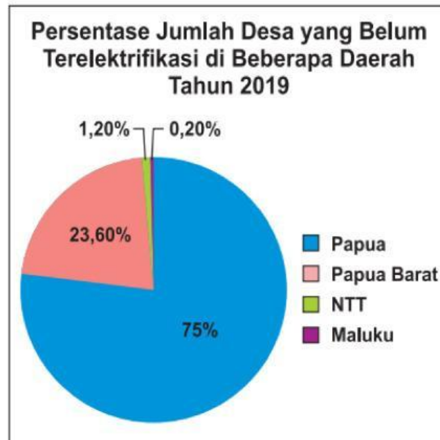
Persentase jumlah desa yang belum terelektifikasi di Indonesia tahun 2019

Masalah tidak hanya sampai pada bagaimana kebutuhan energi listrik dapat tercukupi, pada rapat terbatas yang diselenggarakan pada 3 April 2019 melalui video conference, Presiden Joko Widodo menyampaikan bahwa terdapat 433 desa di Indonesia yang belum mendapatkan aliran listrik.