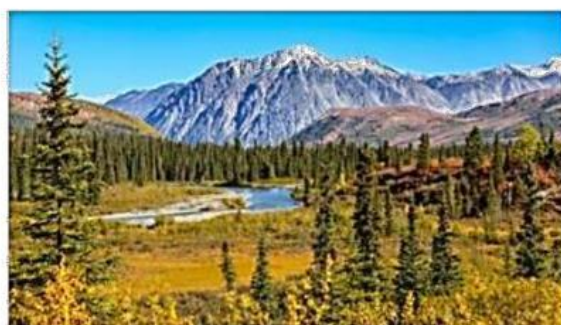
Alaska, Estados Unidos.

3. ¿Por qué, a pesar de la amplia distancia geográfica que existe entre ambos territorios, tienen un gran parecido en su paisaje?