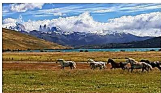
Torres del Paine, Chile.

Observa las imágenes y responde la pregunta 3.